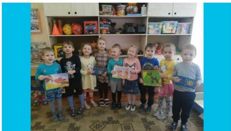
С днем счастья!

В преддверии праздника «Международный День счастья» в детском саду прошла акция «Коробочка счастья» под девизом: «Мы можем делать только маленькие дела, но с Великой любовью». В ходе акции воспитанники вместе с воспитателями собрали «Коробочку счастья», вложив в неё поделки, сделанные своими руками. В рамках данной акции Духовно-родительский клуб «Свет Добра» подарил «Коробочку счастья» в Гундоровский ДИПИ.