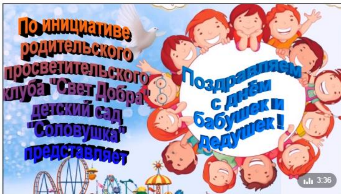
Соловушка поздравляет с днём бабушек и дедушек!