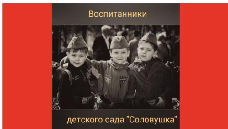
Детская мода 1945-2021

В МБДОУ детский сад «Соловушка» состоялся Флешмоб на тему «От войны к миру: модное путешествие» по страницам модных журналов 1945 года». Активное участие приняли сотрудники и родители, а моделями моды 40-х годов стали воспитанники детского сада «Соловушка» от самых маленьких до выпускников. Преобразившись в немного непривычные наряды, стали похоже на своих бабушек и дедушек в детстве, которые видели на фотографиях.