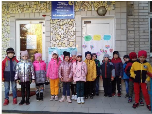
По инициативе род. Клуба «Свет Добра»