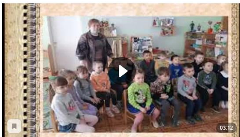
Виртуальное посещение музея воспитанниками детского сада "Соловушка"

В рамках месячника военно-патриотического воспитания Донецкий историко-краеведческий музей в формате виртуальной экскурсии посетили четыре группы воспитанников детского сада "Соловушка".